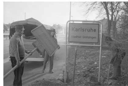
Auswechslung des Ortsschildes anlässlich der Eingemeindung von Grötzingen

EINTRITT FREI. WIR FREUEN UNS AUF IHREN BESUCH.