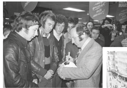
Uwe Seeler beim Signieren eines Fußballs vor einer Autogramm- stunde im Kaufhaus Hertie