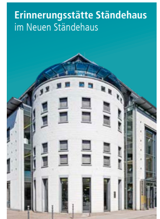
Erinnerungsstätte Ständehaus im Neuen Ständehaus