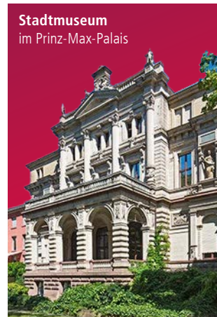
Stadtmuseum im Prinz-Max-Palais