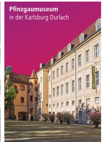
Pfinzgaumuseum in der Karlsburg Durlach