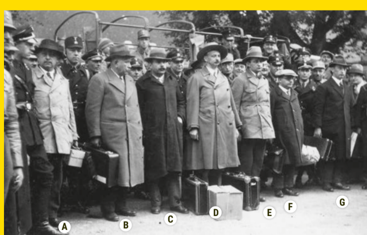
Die sieben Opfer der Schaufahrt bei der Ankunft im KZ Kislau – von links nach rechts: