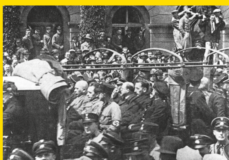
Der Wagen mit den Schaufahrt-Opfern vor dem Karlsruher Rathaus

In der Presse war die Aktion prominent angekündigt worden. Tausende Karlsruherinnen und Karlsruher kamen, um die Männer zu begaffen und zu verhöhnen.