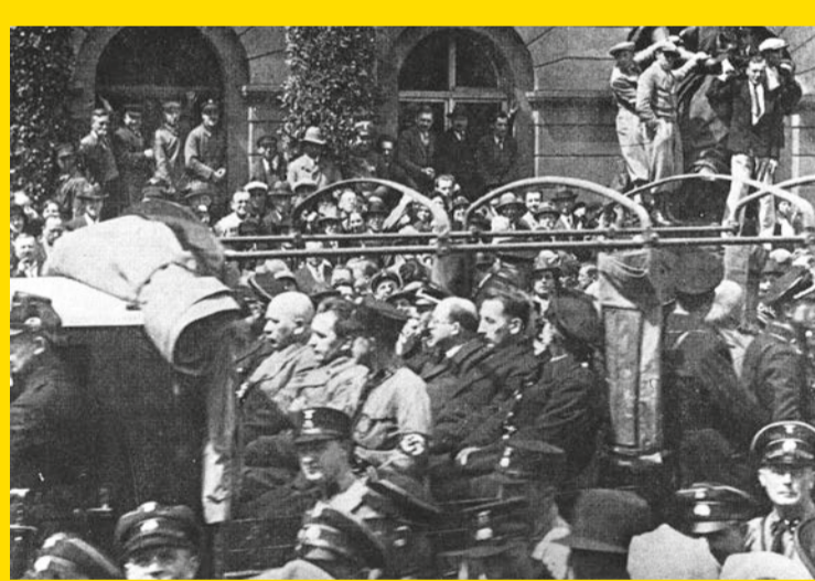
Der Wagen mit den Schaufahrt-Opfern vor dem Karlsruher Rathaus

In der Presse war die Aktion prominent angekündigt worden. Tausende Karlsruherinnen und Karlsruher kamen, um die Männer zu begaffen und zu verhöhnen.