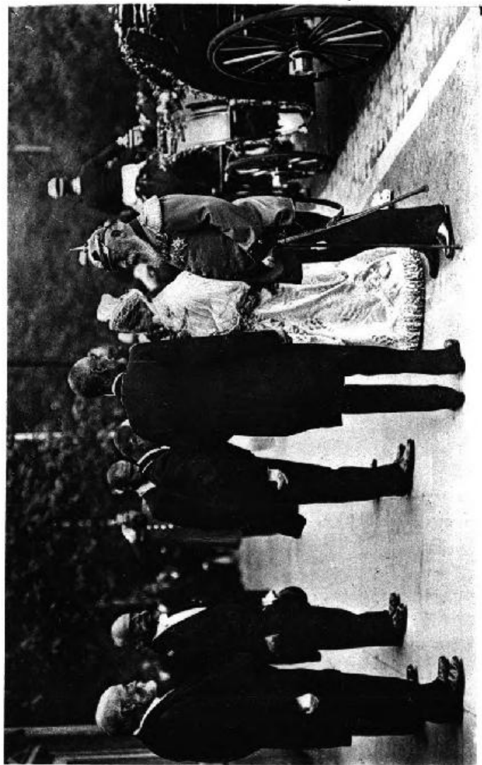
Der Empfang des Großherzogspaares durch die Abordnung der Stadt am Eingang der Festhalle.

Der italienische Botschafter, Graf Lanza, dankte im Namen der fremden Vertreter. Am Abend war Festvorstellung im Hoftheater vor geladenem Publikum. Das Militär war in Paradeanzug, die Hof- und Staatsbeamten in goldgestickten Uniformen, die Damen in lichten Gewändern. Der prächtig dekorierte Raum war taghell erleuchtet. Leichte, duftige Blumengewinde schlängeln sich von Rang zu Rang und schlossen oben mit einer dichten, bunt besetzten Laubguirlande ab. Beim Erscheinen der Herrschaften gegen 9/10 Uhr brachte Intendant Geh. Hofrat Dr. Bassermann das Hoch auf den Großherzog, die Großherzogin sowie den Kronprinzen und die Kronprinzessin von Schweden aus. Die Festvorstellung begann mit dem Vorspiel zu Richard Wagners „Meistersinger von Nürnberg“, an das sich der 3. Akt, festweise, mit Ausschluß der Beckmesserzene anschloß. Am Schlusse der Festweise leitete das Orchester zur Landeshymne über. Die Solisten traten an die Rampe und hinter ihnen nahmen die übrigen Mit-