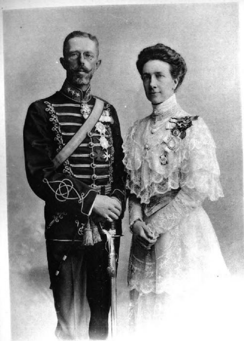
Kronprinz und Kronprinzessin von Schweden bei der silbernen Hochzeit.

Donnerstag den 13. September begaben sich der Großherzog, die Großherzogin und die Kronprinzessin von Schweden nach Konstanz. Im großen Saale des Kaufhauses fand ein Huldigungsakt statt, bei dem nach einleitendem Musik- und Gesangsvortrag Oberbürgermeister Weber eine Begrüßungsansprache an die Herr-