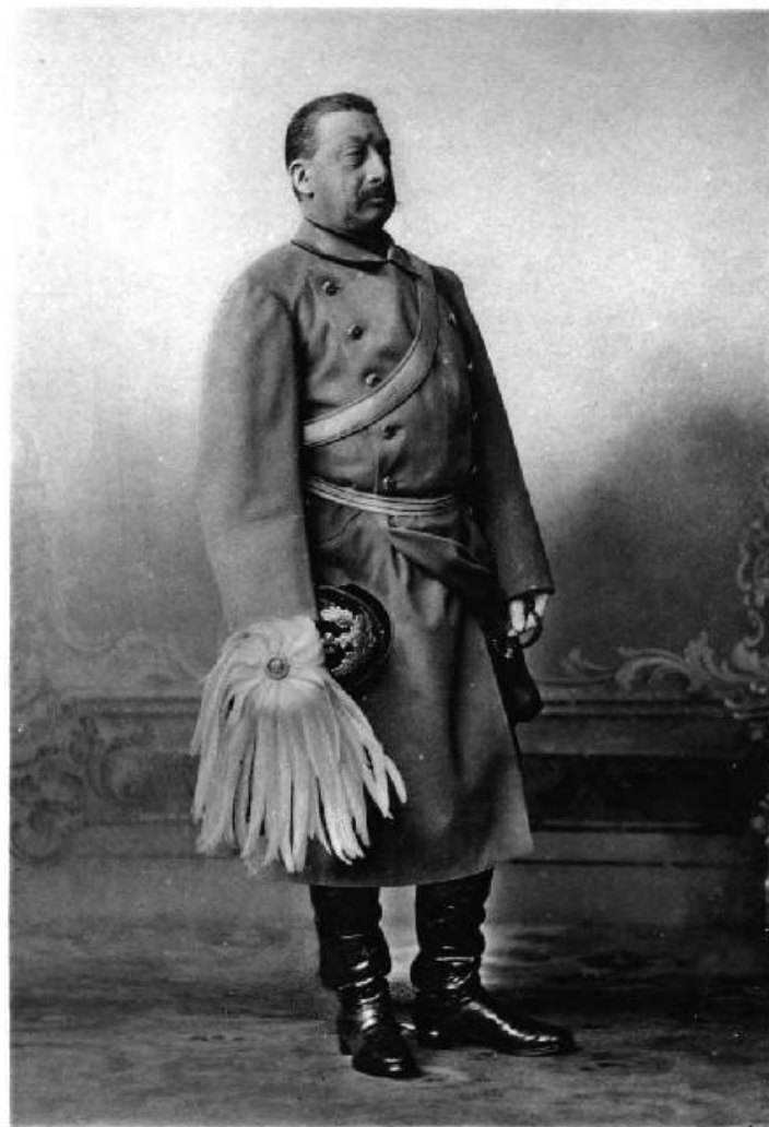
Prinz Karl von Baden.

Das Großherzogliche Haus wurde am Montag den 3. Dezember in Trauer versetzt. In der Frühe halb 8 Uhr ist Prinz Karl, der Bruder des Großherzogs, sanft verschieden. Er war am 9. März 1852 als zweitjüngstes Kind des Großherzogs Leopold und der Großherzogin Sophie geboren. Der Verstorbene war im November bereits in Baden nicht unbedenklich erkrankt, kehrte aber noch am 22. nach Karlsruhe zurück. Am 30. veröffentlichten die behandelnden Ärzte folgenden Bericht: „Bei Seiner Großherz. Hoheit dem Prinzen Karl sind schon seit längerer Zeit Krankheitserscheinungen aufgetreten, die auf eine Veränderung der Arterien zurückzuführen sind. Das Befinden Sr. Großh. Hoheit hat im Laufe des gestrigen Nachmittags insofern eine Verschlimmerung erfahren, als Fieber auftrat, welches mit teilweiser Trübung des Bewußtseins einherging. Im Laufe der Nacht sank die erhöhte