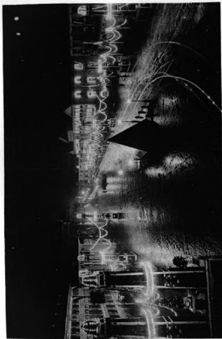
Aufschmückung des Marktplatzes.

Das Bahnhofgebäude war an allen Konturen vom Sockel an bis hinauf in die höchste Turmspitze mit elektrischen Flammen übersät. Die Kaiserstraße bildete von der Bernharduskirche bis zum Kaiserplatz ein Flammenmeer. Die mächtigen Initialen und die Inschriften über dem Portale der Technischen Hochschule waren taghell erleuchtet und weithin lesbar, das ganze Gebäude war mit einer Anzahl elektrischer Lämpchen abgegrenzt. In überaus wirkungsvollem Lichterglanze erstrahlte das Postgebäude. Am Sockel des Kaiserdenkmals flimmerte ein großer Stern unzähliger Lichter und um den Kaiserplatz verbreiteten Kandelaber ihren hellen Schein. In der Waldstraße reiheten sich von Tanne zu Tanne rote Ballons und die Bogen am Schloßplatz waren einer