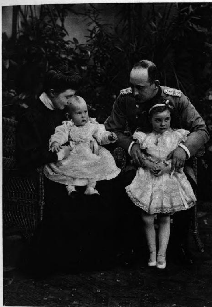
Prinz und Prinzessin Mar mit ihren Kindern, Prinzessin Marie Alexandra und Prinz Bertold.