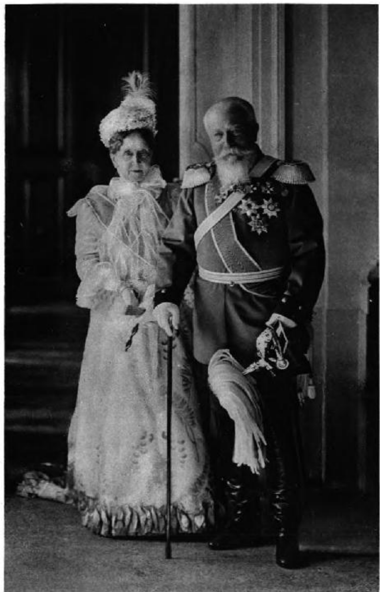
Das Großherzogspaar bei der goldenen Hochzeit.