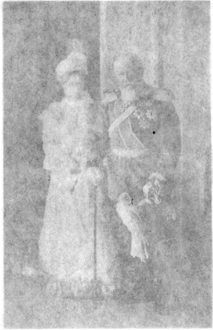
Das Brautpaar bei der goldenen Hochzeit