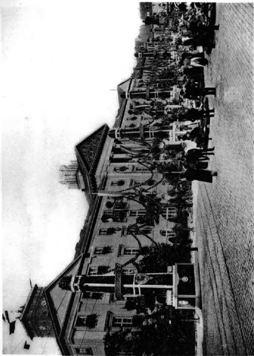
Ausschmückung des Marktplatzes. (Rathaus.)

Durch die Stadtverwaltung waren vom Bahnhofe bis zum Schlosse die Straßen von einem Mastenpalier eingefäumt worden, von dem wehende Flaggen, Fähnchen- und Blumen-Dekorationen ein farbenprächtiges Bild gewährten. Auf dem Marktplatze ragten zwei Reihen mächtiger Pylone, geziert mit Tannengrün, frischem und künstlerischen Blumen, Malereien, empor. Mächtige, reich dekorierte Ringe, übersät mit Blüten, in deren Kelchen elektrische Glühlämpchen schimmerten, umschlossen die Pylone etwa in halber Höhe. Die Spitze der Pylone trug Blumengewinde und war eben-