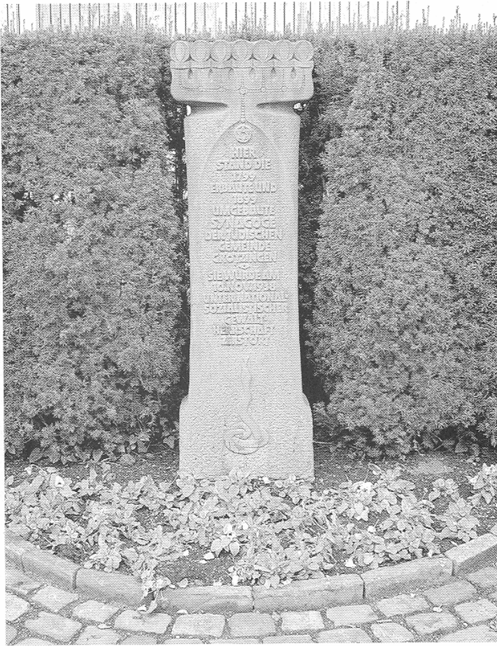
Stele zum Gedenken der Zerstörung der Synagoge von Gerhard Karl Huber ( 9. November 1983 eingeweiht)