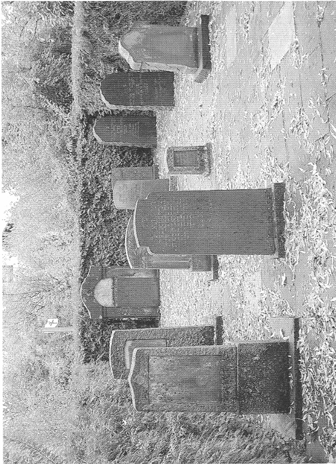
Jüdischer Friedhof Grötzingen