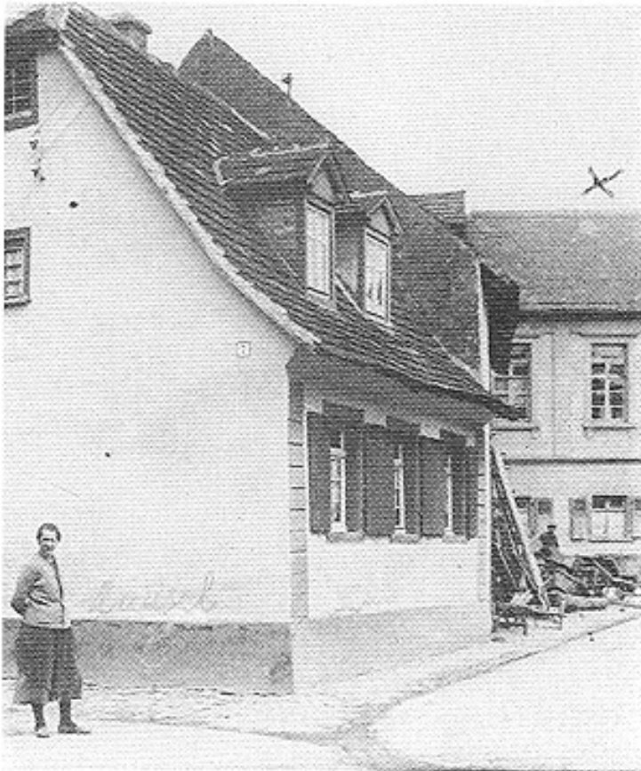
Hintergrund: Die Synagoge von Grötzingen, die 1938 zerstört wurde. in: Susanne Asche, Grötzingen, S 254