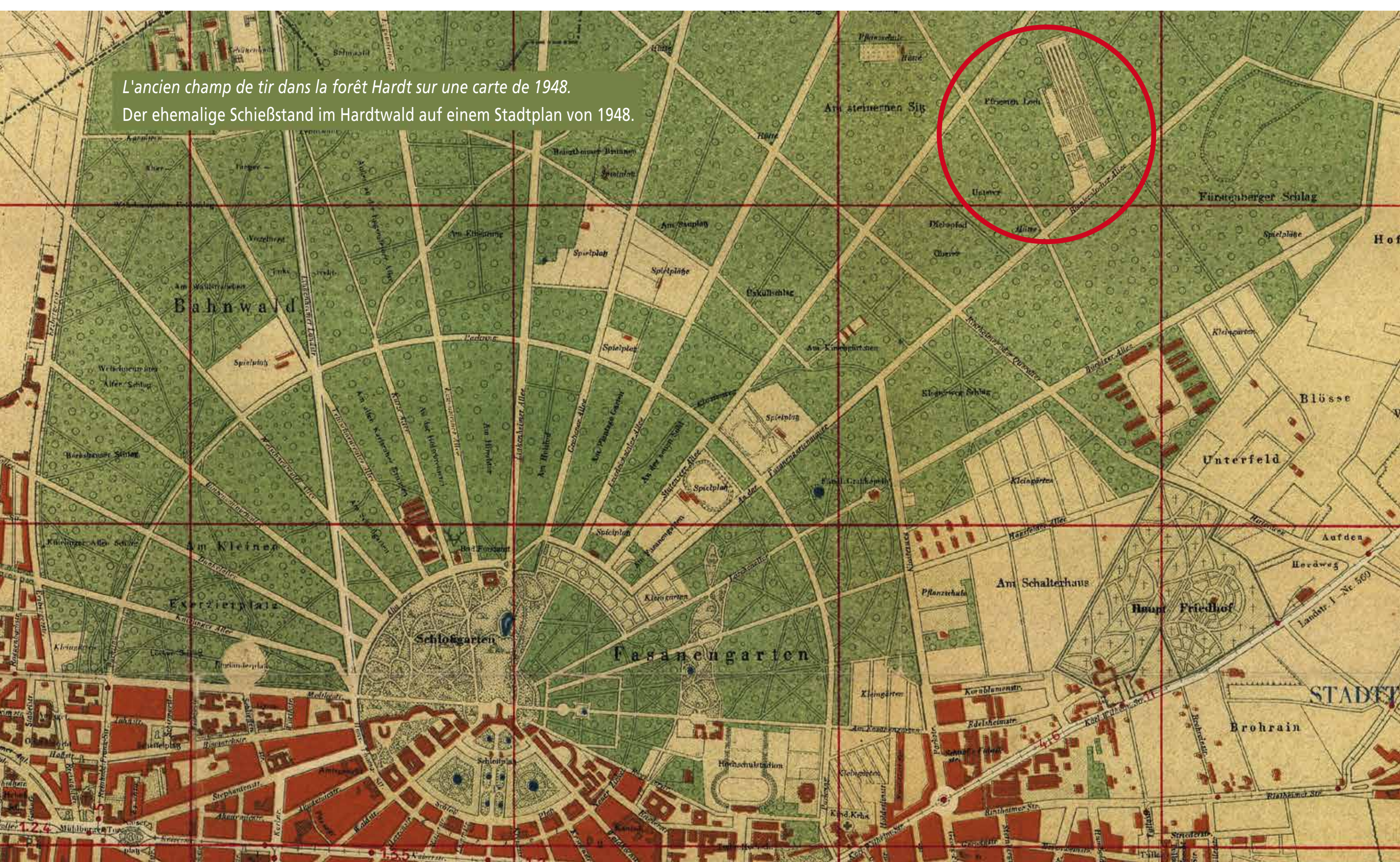
L'ancien champ de tir dans la forêt Hardt sur une carte de 1948. Der ehemalige Schießstand im Hardtwald auf einem Stadtplan von 1948.

http://www.karlsruhe.de/qr/reseau-alliance