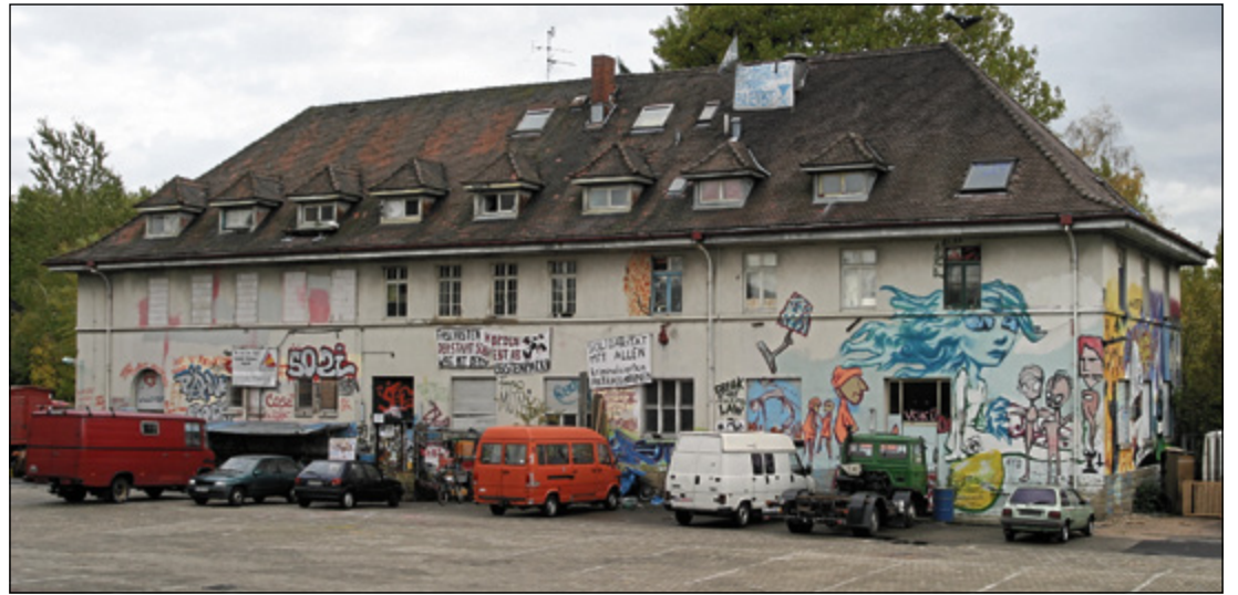
Ex-Steffi in der Schwarzwaldstraße 79, Foto 2003

Bereits im Mai 2002 hatte die Stadt in einem Schreiben an die Ex-Steffi-Bewohner angekündigt, dass der Mietvertrag nach Auslaufen im Sep-