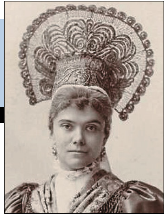
1858 – 1930