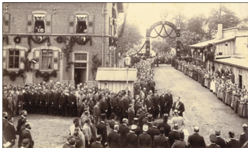
Arbeiterinnen der Deutschen Waffen- und Munitionsfabrik in Karlsruhe beim Besuch Großherzogs Friedrich I. im Mai 1895.

Nun folgte ein eineinhalbstündiges Referat von Luise Zietz, die ausführte, dass die politische Betätigung für Frauen notwendig sei, da der Kapitalismus sie in den Produktionsprozess gezogen habe: „Ein Stein um den anderen ist aus dem Haus gerissen worden, daß die Frau umschloß.“ Daher müsse die Frau Interesse am Staatsleben haben, an dem Koalitionsrecht der Arbeiterinnen, an der Schutz-, Zoll-, Steuer-, Heeres- und Marinepolitik, an der Entwicklung des Schulwesens und der Fabrikinspektion. Zu gewinnen seien die Frauen durch Versammlungs- und Hausagitation, die praktische Schulung der gewonnenen „Genossinnen“ geschehe durch alle Arbeiten der Gesamtpartei. Die theoretische Schulung erfolge vor allem durch Parteiversammlungen, lediglich ergänzt durch Diskussions- und Leseabende. Damit formulierte Luise Zietz das Ziel, die Frauen in die Gesamtpartei zu integrieren. Möglich sei