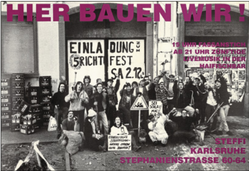
Fest zur fünfjährigen Besetzung der Steffi, 1995

Die Besetzung der „Steffi“ war circa vier Monate lang von einer Gruppe konspirativ vorbereitet worden, darunter viele ehemalige Bewohner und Bewohnerinnen der in Karlsruhe geräumten Häuser und Aktive aus dem MieterInnenladen. Zur damaligen Zeit standen verschiedene Gebäude in der Karlsruher Innenstadt leer, ein übergeordnetes Ziel der Besetzungsaktion war daher, auf den Leerstand und den daraus resultierenden fehlen-