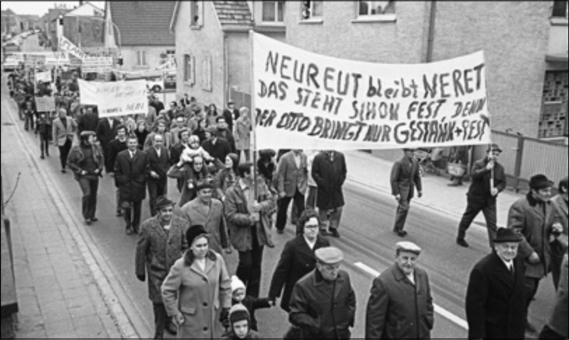
Demonstration in Neureut gegen die Eingemeindung nach Karlsruhe am 13. März 1973.

Mit der Eingemeindung dieser sechs, wenn man Grünwettersbach und Palmbach getrennt zählt, sieben ehemals selbstständigen Gemeinden hatte Karlsruhe seine aktuellen Gemarkungsgröße von 17.346 ha erreicht, wozu die Eingemeindungen mit etwa 73 Prozent beigetragen haben. Die Karlsruhe Gemarkung hatte sich damit seit der Stadtgründung um mehr knapp das 110-fache vergrößert. Die mit den Gemeinden ausgehandelten Eingemeindungsverträge mit z. T. erheblichen Investitionszusagen belegen das starke Interesse der