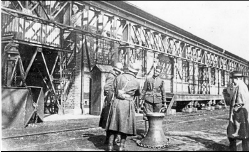
Besetzung des Karlsruher Rheinhafens durch französische Soldaten am 3. März 1923.

Durch die Besetzung konnte die Stadt auch nicht auf dort gelagerten Auslandsweizen zurückgreifen, wodurch die ohnehin schwierige Versorgungslage zusätzlich erschwert wurde. Die französischen Truppen beschlagnahmten außerdem andere Güter, die nach Frankreich gebracht wurden. Der Schaden betrug schließlich mehrere Millionen Goldmark. Die Arbeit kam sofort weitgehend zum Erliegen, so dass die rund 2.500 Arbeiter fast alle auf die Unterstützung durch die Rhein-Ruhrhilfe angewiesen waren. Am 12. Mai erweiterten die französischen Truppen die Besat-