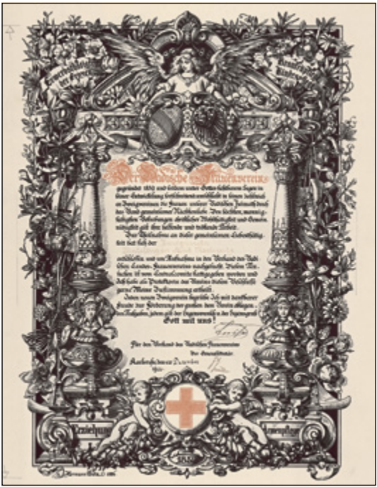
Aufnahmeurkunde für den Zweigverein von Knielingen. Foto: Stadtarchiv Karlsruhe 1906

Verbunden war dies mit dem Ziel, die Gefahren einer sozialen Revolution, die mit der Sozialdemokratie und den Gewerkschaften verbunden wurden, zu dämmen. In der Annahme, ein gut gekochtes Abendessen und eine behaglich eingerichtete Wohnung hielten den Mann davon ab, ins Wirtshaus zu gehen, lag die Hoffnung, befriedend in die Gesellschaft wirken zu können. Während die Frauen der SPD darum warben, dass die Ehemänner mal zuhause bleiben sollten, damit die Frauen ins Wirtshaus zu den Parteiversammlungen gehen konnten,