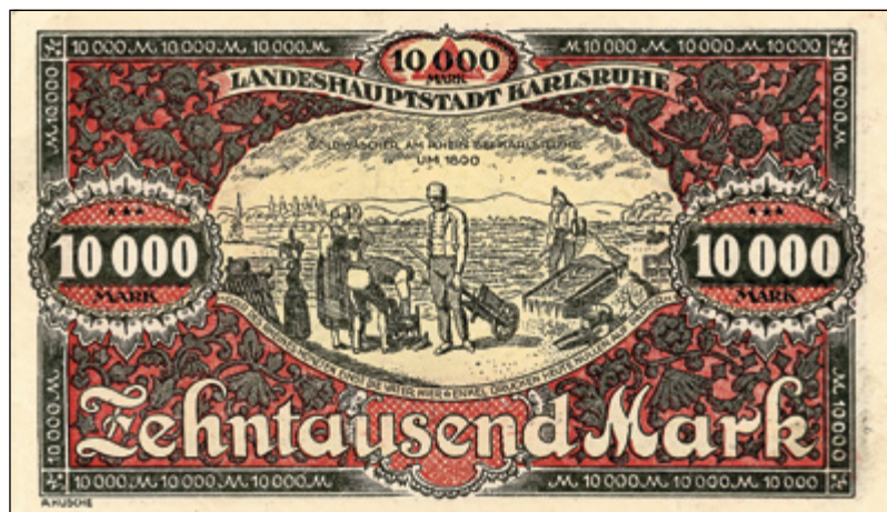
Von Alfred Kusche gestalteter Karlsruher Notgeldschein.

Nach der Ausrufung des passiven Widerstands fielen Anfang 1923 die Kohlelieferungen aus dem Saarland und dem Ruhrgebiet völlig aus. Ersatz musste zu höheren Preisen im Ausland besorgt werden. Bereits im Herbst 1922 hatte das Fürsorgeamt einen beheizten Schulraum für alleinstehende Frauen und Mädchen beantragt. Die Stadt unterhielt zu diesem Zeitpunkt schon Wärmestuben vor der Festhalle und in der Mittelstandsküche des Vereins für Evangelische