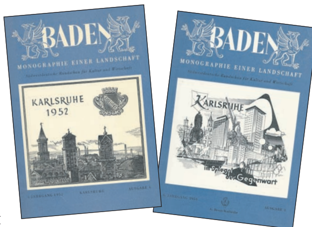
Das Titelblatt der Zeitschrift Baden von 1952 zeigt die drei wichtigsten Türme der Bürgerstadt und in der Ferne Fabrikschlote. Zwei Jahre später steht ein neues Karlsruhe im Vordergrund.

Die heutige Nordweststadt war ein erster Schwerpunkt. Die Siedlungstätigkeit nahm in den 1920er Jahren ihren Anfang mit dem Projekt der Genossenschaft Eigenhandbau zwischen Hertzstraße, St. Barbaraweg und Postweg. Aber erst Anfang der 1950er Jahre setzte sich der Siedlungsbau mit der Siemenssiedlung im Gewinn Binsenschlauch fort, ein für Karlsruhe und die damalige Zeit beachtenswerter Beitrag zum Wohnungsbau eines Konzerns. In den 1960er Jahren schloss sich die Bebauung Lange Richtstatt nach Norden an. Die eigentliche Binsenschlauchsiedlung – ebenfalls in den 1950er Jahren von Donauschwaben errichtet – liegt nördlich des Madenburgerwegs. Die Rennbuckelsiedlung geht auf Planungen der Stadt im Jahre 1951 zurück. Für 4 000