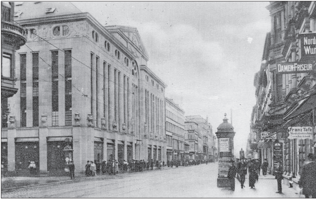
Der 1912–1914 errichtete Neubau des Warenhauses Knopf.