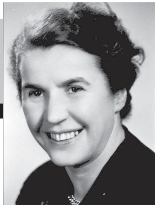
1914 – 2005