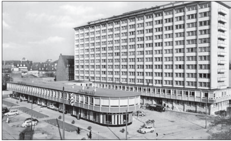
1953–1955 entstand das Hochhaus mit vorgelagerter Einkaufszeile an der Ecke Karl-/Mathystraße (Schmiederplatz).

In Mühlburg baute die Volkswohnung zwischen 1953 und 1957 eine Wohnsiedlung mit über 1 300 Wohnungen, davon über 900 Wohnungen in fünfgeschossigen, bis zu 80 Meter langen Zeilen für Zwei- beziehungsweise Drei-Zimmerwohnungen. Die Teilnehmer eines vorausgegangenen Wettbewerbs kamen leider nicht zum Zug. Nach dem städtischen Bauungskonzept Mühlburg-Ost war westlich des Entenfangs eine Hochhausgruppe als architektonischer Akzent und Auftakt für das neue Wohngebiet gedacht. Hier entstand dann auch 1954 das erste Hochhaus in Karlsruhe,