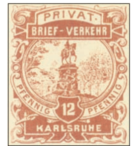
Briefmarken der beiden privaten Unternehmen mit Karlsruher Motiven.