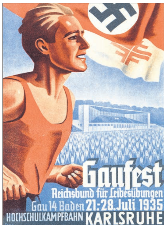
Zentrales Plakat-Motiv des Gaufestes, das auch den Umschlag des eigens herausgegebenen „Arbeits-Buches“ zierte.

Bereits am Tag der Eröffnungsfeier des Gaufestes wurde in der NS-Zeitung „Der Führer“ gemeldet, dass führende Karlsruher Geschäfte und Gaststätten Schilder mit der Aufschrift „Deutsches