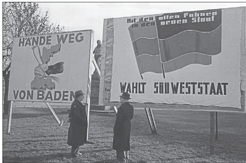
Plakatwerbung bei der Volksabstimmung über den Südweststaat 1951.