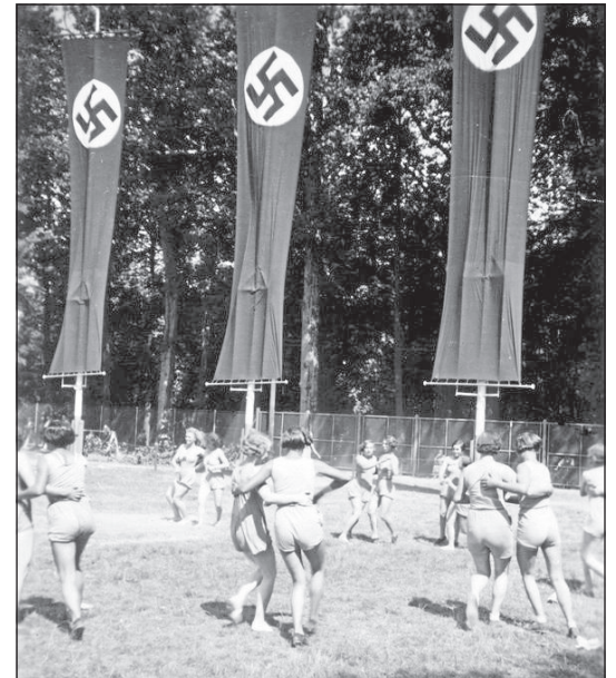
Schauvorführung von Turnerinnen beim 1. Gaufest für Leibesübungen.